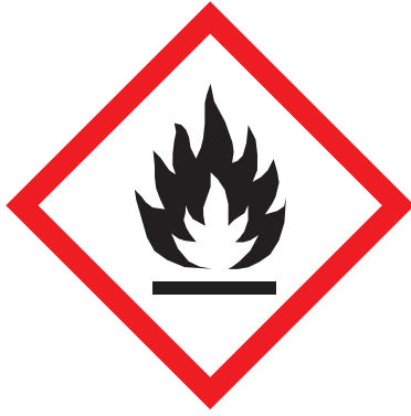
غازات وسوائل وضبوبات (أيروسولات) ملتهبة

وينبغي تمييز جميع المواد والسوائل القابلة للاشتعال ببطاقات تعريف على النحو والشكل المناسبين، وتخزينها في حاويات مناسبة مقاومة للحريق. أما فيما يتعلق بتخزين المواد الكيميائية، فينبغي استخدام شارات التحذير المنصوص عليها في النظام المُنسَّق عالمياً لتصنيف المواد الكيميائية ووسمها 6,7 لاسيما الشارات التي تُحذِّر من الأخطار التالية: