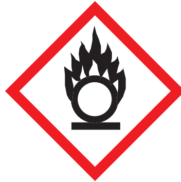
سوائل ومواد صلبة مؤكسدة

وسيضمن تنفيذ ممارسات التدبير والترتيب الجيدين وإجراء عمليات تفتيش منتظمة على مكان العمل التحكم الفعال في المواد القابلة للاشتعال في مكان العمل.